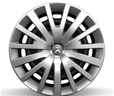
Enjoliveur 15" Ambre