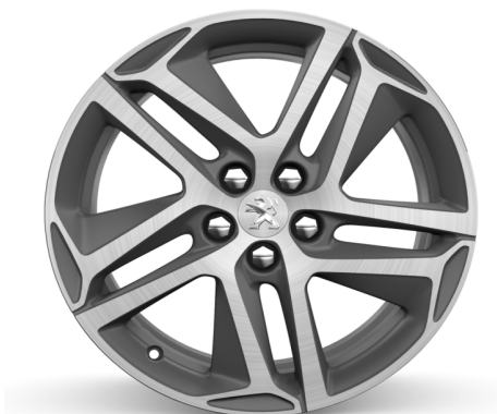
Jantes Aluminium 18" Diamantées SAPHIR