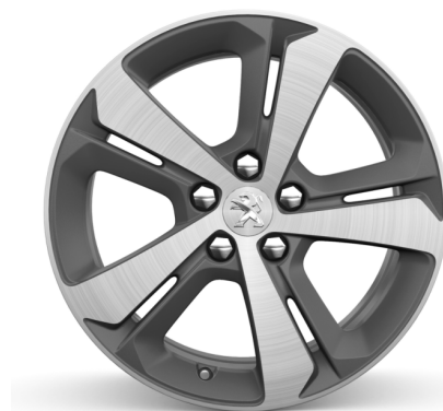
Jantes Aluminium 17" Diamantées RUBIS