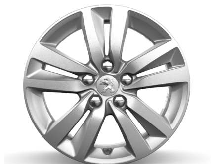
Jante Aluminium 16" Quartz