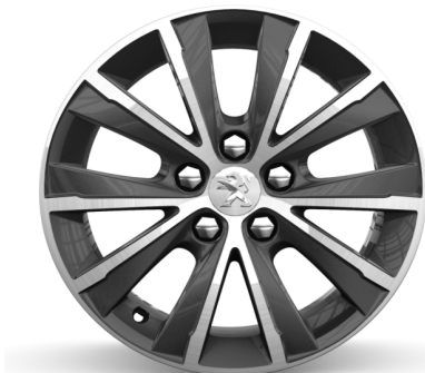
Jantes Aluminium 16" Diamantées TOPAZE