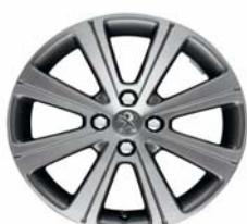
Jante alliage Melbourne 17"