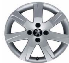
Jante alliage Santiagouito 2.16"