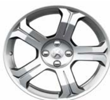
Jante alliage Licancabur 18"