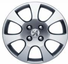
Enjoliveur Toliman 16"