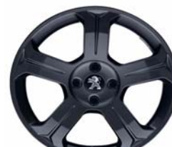
Jante alliage Licancabur 18" Dark Storm