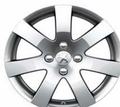
Jante alliage Santiagouito 1.16"