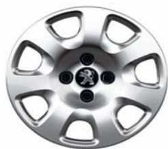
Enjoliveur Atacama 15"

** Option Gratuite sur Féline (inclus avec la prise d'option Roue de secours homogène alliage)